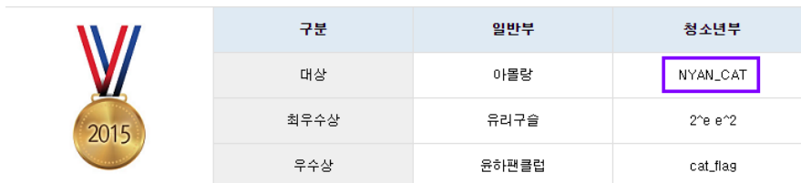
그림 2. 2015 화이트햇 콘테스트 명예의 전당

일반 해킹 대회에서 인증 형식이나 기타 문제를 체크하기 위해 이런 간단한 문제를 출제하기도 하지만 본 문제를 통해 기존에 화이트햇 콘테스트에서 어떤 팀들이 역사적으로 상을 받아 왔는지 명예의 전당 페이지(Hall Of Fame 1 )를 통해 알 수 있었음.