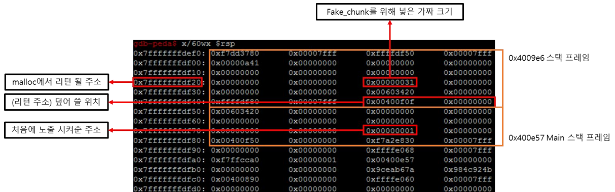
그림 30. 문제 11 - malloc 될 위치의 스택 구조

처음에 노출이 되는 스택 주소를 이용하여 필요한 모든 offset들을 계산 할 수 있다.